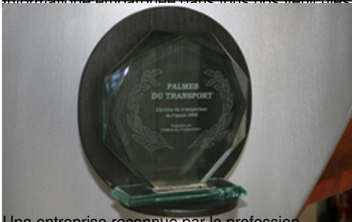
Une entreprise reconnue par la profession