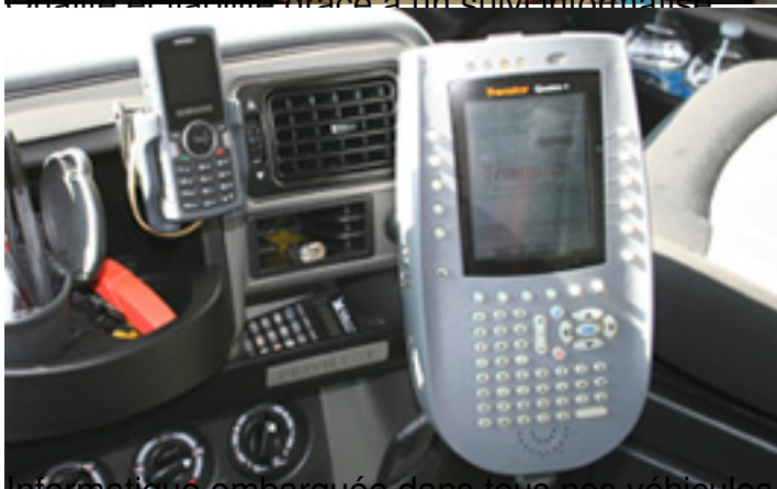
l'information embarquée dans tous les véhicules